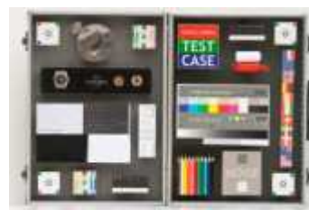
afb 2c | EF 300mm f/4L IS