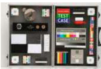
afb 2a | EF 70-300mm f/4-5,6 IS

Alle vier lenzen hebben een beeldcirkel behorend bij een volbeeldsensor. 90% van de EOS-camera's hebben echter een kleinere APS-c sensor. Lensafwijkingen die betrekking hebben op de rand van de beeldcirkel, zoals vervorming, vignettering en hoekonscherpte, liggen ver buiten het kader van de APS-c sensor en zijn bij een EOS 1000D dus nauwelijks aanwezig.