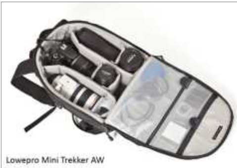
Lowepro Mini Trekker AW