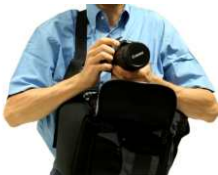
clip 1 | de werking van een Sling rugtas

Een belangrijk accessoire voor een fotograaf als hij op vakantie gaat is een goede fototas. Maar ook bij alle andere uitstapjes 'het veld' in is de juiste fotorugtas of -koffer van groot belang. Er zijn van diverse merken veel maten en soorten, in veel uitvoeringen en prijsklassen. In dit artikel een klein overzicht van het aanbod en waar je op moet letten als je een nieuwe tas aan gaat schaffen.