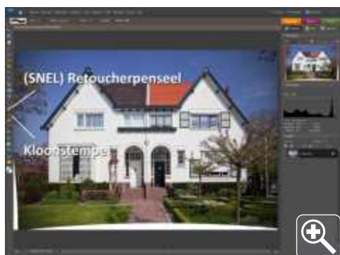
afb 1 | het (Snel) retoucheerpenseel en het Kloonstempel.

Als je een foto maakt, probeer je zoveel mogelijk alle onderdelen in het kader op de juiste plaats te rangschikken en ongewenste elementen buiten de compositie te houden. Toch lukt dat niet altijd en moeten we achteraf deze 'vlekjes' wegwerken. Maar ook stof op de sensor en rotatie of vervorming van de foto bij het corrigeren van een horizon of lensafwijkingen moeten soms worden bijgewerkt. Al deze handelingen vallen onder de noemer retoucheren en we kijken in deze workshop wat Photoshop Elements 7 ons te bieden heeft.