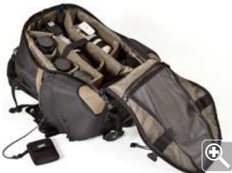
afb. 3 | Tenba Shootout Backpack

Dit is een klassieker met ook een klassiek ontwerp en indeling. Toch bewijst deze rugtas nog steeds zijn waarde in alledaags gebruik en is ze ondanks zijn compacte afmetingen geschikt om een EOS 5D met 24-105mm, drie gewone lenzen, een 70-200mm en een flitser mee te nemen (6,8 kg) en zijn er voldoende vakken voor papieren, telefoon en accessoires. De rugvoering en de schouderriemen zorgen voor een gemiddeld comfort. Materiaal en afwerking kunnen tegen een stootje, maar zijn niet bedoeld voor extreme omstandigheden.