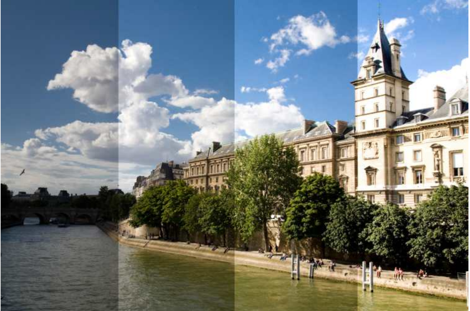
afb. 1 | voorbeeld van een trapje