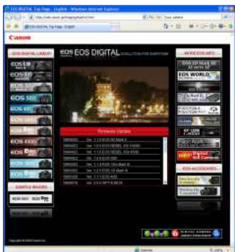
>> download firmware 1.1.0 voor Canon EOS 5D mkII

Zelden zal een firmware-update zo met open armen ontvangen zijn dan versie 1.1.0 van de Canon EOS 5D mkII. Niet omdat er problemen zijn met deze camera. Integendeel. Maar omdat het dankzij deze update mogelijk wordt om te filmen met volledige controle over ISO, sluitertijd en diafragma. Dat betekent dat je nu ook buiten bij veel licht kunt werken met kleine scherptedieptes en dus een mooi vervaagde achtergrond. Je hoeft in dit geval dus niet, zoals bij de vorige firmware, met ND-filters te werken en dat verhoogt de flexibiliteit. Ook kun je nu zelf de sluitertijd instellen met een minimum van 1/4000s. Dit maakt het mogelijk om met 30 beelden per seconde haarscherpe HD-foto's (1920 bij 1080 pixels) te maken van snel bewegende onderwerpen. Je kunt dan achteraf exact het juiste frame kiezen van bijvoorbeeld een vallend ei of een waterballon die uiteenspat.