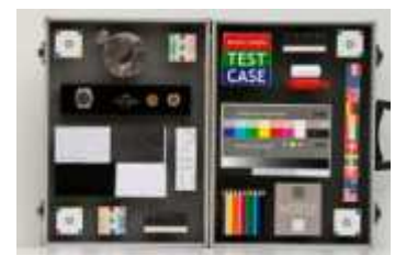
afb 2d | EF 100-400mm f/4-5,6L IS