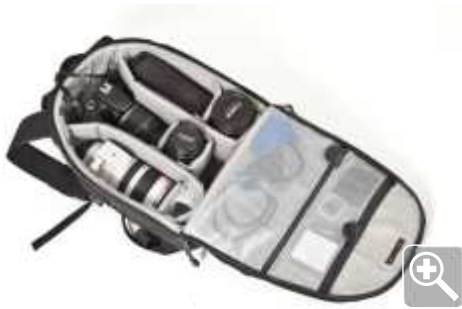
afb. 1 | klassieke en compacte camerarugtas

Je gaat op vakantie en neemt mee.... Als fotograaf denk je dan niet aan een paar sokken en een zwembroek, maar aan je camera, de benodigde lenzen en handige accessoires om ook 'in den vreemde' prachtige foto's te kunnen maken. Wij hebben een kort lijstje voor je gemaakt, zodat je niets hoeft te vergeten.