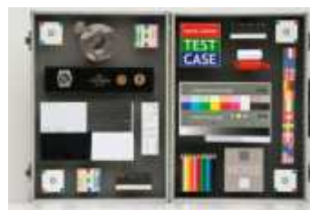
afb 2b | EF 70-300mm f/4-5,6 DO IS