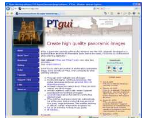
afb 2 | koppeling naar website www.ptgui.com