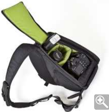
afb. 2 | Tenba Photo Sling Gen-3

Zoals gezegd is een Sling tas bij uitstek geschikt voor mensen die 'on the move' zijn. Je draait de tas eenvoudig van je rug naar je borst en kunt dan snel je camera in gereedheid brengen. In dit model past moeiteloos een EOS 5D met standaardlens en twee extra lenzen. Een flitser past desgewenst in een apart compartiment. Ook zijn er voldoende vakjes voor de diverse accessoires. Een volle tas weegt 4,5 kg, maar door de brede en zachte draagriem kun je er heel comfortabel grote afstanden mee afleggen. Het materiaal is gelijk aan de andere standaard tassen en de ritsen lopen ook na veelvuldig gebruik, erg soepel.