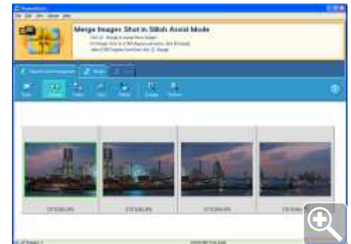
afb 1 | screendumps van de drie stappen in PhotoStitch

Software-tip: PhotoStitch is in zijn klasse een perfect programma om panorama's te monteren uit overlappende foto's. Werk je echter met afwijkende onderwerpen en met groothoek- of zelfs fisheye-lenzen, dan komt ze functionaliteit tekort. Ben je dus professioneel met panorama's bezig, kijk dan eens naar PT Gui. Je kunt er zelfs direct RAW-bestanden in verwerken en ook matrix-montages met deelfoto's zowel in horizontale als verticale richting. Dit programma van Nederlandse makelij is te vinden op www.ptgui.com .