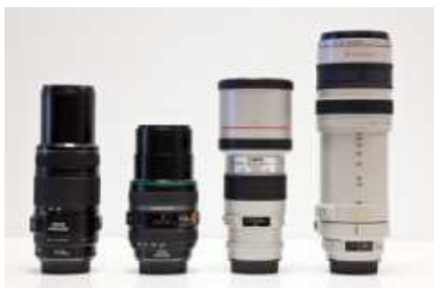
afb 1 | v.l.n.r. - EF 70-300mm f/4-5,6 IS - EF 70-300mm f/4-5,6 DO IS - EF 300mm f/4L IS - EF 100-400mm f/4-5,6L IS

In het lijstje van vakantiefoto-accessoires in dit nummer hebben we een telelens opgenomen, zodat je tijdens je vakantie onderwerpen dichterbij kunt halen en zo fantastische close-ups en waanzinnige candid's kunt maken. Maar welke lens past het best bij jouw wensen? Wij hebben vier modellen in de EF-familie van Canon aan de tand gevoeld.