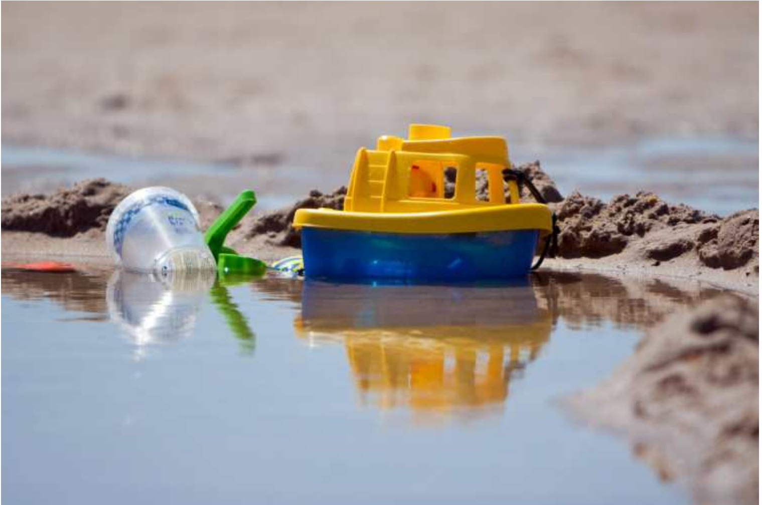
afb. 1 | voorbeeldopnamen met een Powershot SX200 IS

controle. De Menu-knop geeft toegang tot de algemene instellingen van de camera en met de Functie-knop stel je onder andere ISO en witbalans in. Met een vierwegknopje navigeer je door de instellingen en je kunt er tevens snel de belichtingscompensatie, macro of flitsmodus mee bedienen. De functieknop is wat aan de kleine kant en het instelwiel rond de vierwegknop is een goed idee (overgenomen van de EOS-camera's), maar van de praktische uitvoering worden we niet enthousiast, hoewel het gedurende het dagelijks gebruik went. Verder is de camera heel alert. Aanzetten, scherpstellen en een foto nemen gaat zonder noemenswaardige vertraging